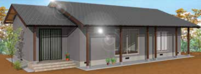
パースはイメージです

「和」の美しさ 無垢の床材・天井材の美しさ。 思い出のある建具を再利用した 家をぜひご覧ください。